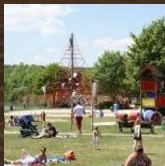
LAC DE L'EAU D HEURE CERFONTAINE