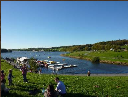
PARC DU VAL JOLY (FR)