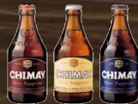
LES BIERES TRAPPISTES CHIMAY