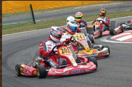
KARTING DES FAGNES MARIEMBOURG