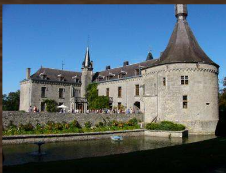
CHÂTEAU DE BOUSSU EN FAGNES