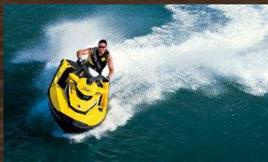
LAC DE L'EAU D HEURE CERFONTAINE