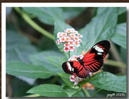
LA GRANGE AUX PAPILLONS VIRELLES