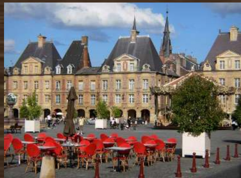
VILLE CHARLEVILLE MEZIERES (FR)