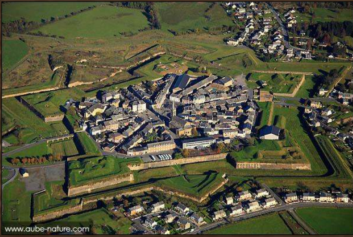
VILLE FORTIFIEE ROCROI ( FR )