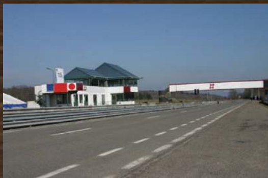
CIRCUIT DE CHIMAY