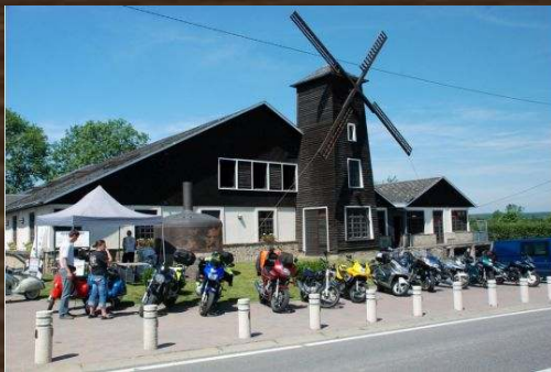
BRASSERIE DES FAGNES MARIEMBOURG