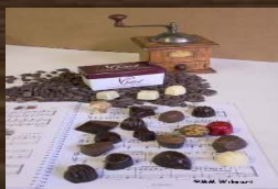
CHOCOLATERIE GILLOT 6464 L ESCAILLERE