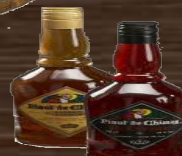
LES PINOTS DE CHIMAY