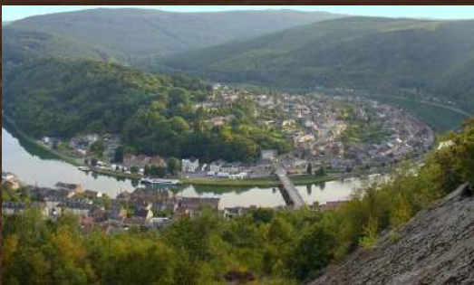
LA VALLEE ARDENNAISE REVIN FUMAY ( FR )