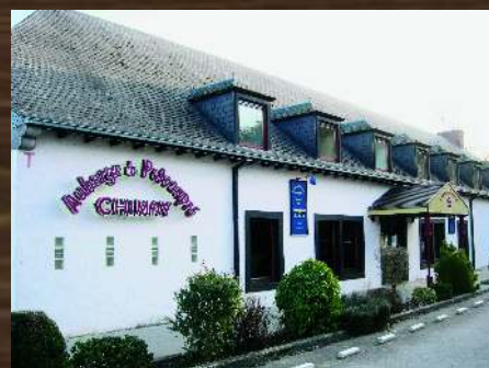
ABBAYE DE POTEAUPRE BOURLERS