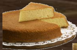
LE GATEAU CHIMACIEN