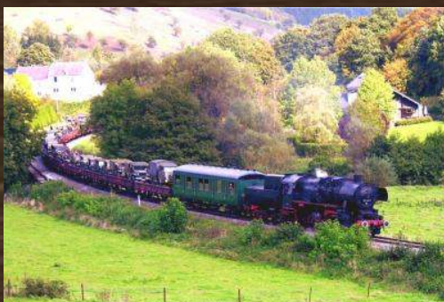
TRAIN VAPEUR DES 3 VALLEES MARIEMBOURG