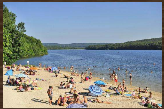
LAC ET PLAGE VIEILLES FORGES ( FR)