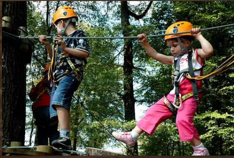
TERRE D' AVENTURE VIEILLES FORGES (FR)