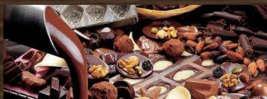
CHOCOLATERIE ARTISANALE PESCHE