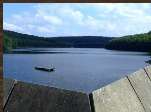
BARRAGE DU RY DE ROME PETIGNY