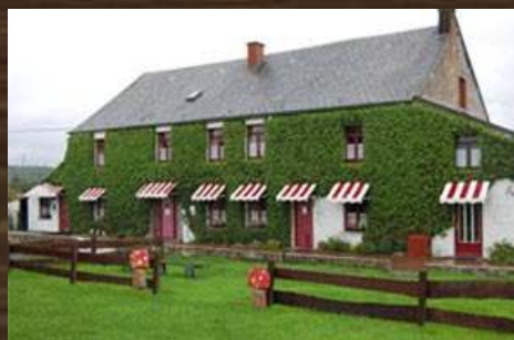
FERME DE LA GALOPERIE AUBLAIN