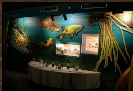
AQUASCOPE AU LAC DE VIRELLE