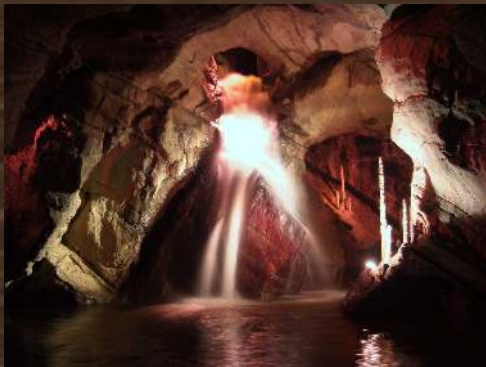
LES GROTTES DE NEPTUNE PETIGNY