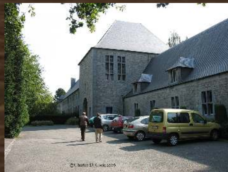
ABBAYE DE SCOURMONT FORGES LES CHIMAY