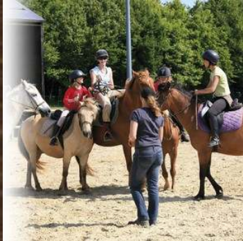
PARC DU VAL JOLY (FR)