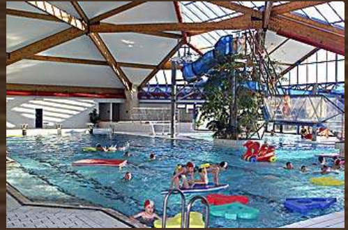
PISCINE ROCROI (FR)