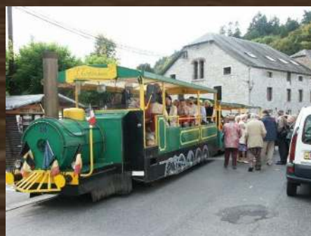
TRAIN TOURISTIQUE NISMES