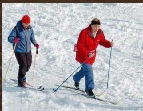
PISTES SKI DE FOND RIEZES OU ESCAILERE