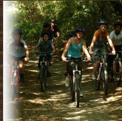
PARC DU VAL JOLY (FR)